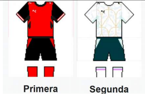
Österreichs Farbauswahl bei Trikot