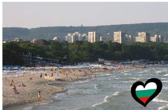
Gewinner des Songcontest 2026 ist vielleicht auch Warna - Schwarzes Meer Crédito W Público Hyperlink Tourismus Information https://visitbulgaria.com

Siehe alternatives Video von 2026 – This Is Me (Song)