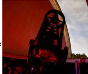
Credit Public Dr. Ralph L. Buice Jr. Observatory Teleskop mit um 0,9 Meter Spiegelteleskop bei Atlanta

Atlanta USA – Wenn mal Pause am Stadionrasen ist, wie wäre es mit einem Besuch des Fernbank Science Center bei Atlanta und zum Beispiel der Sternwarte dort (Fernbank)?