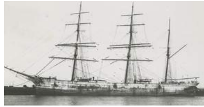
Viermastbark Lorton (gebaut 1888)..

Im Beispiel erklärte Peru dann seine Solidarität mit den Vereinigten Staaten (Jahr 1917), nachdem die Deutsche Kriegsmarine Schiffe Perus versenkt hatte, die erkennbar unter peruanischer Flagge fuhren.