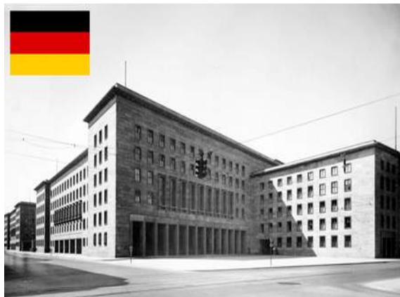
Bild aus der europäischen Geschichte: Wilhelmstraße 97 – das Reichsluftfahrtministerium im Zweiten Weltkrieg

Nach Sieg der Anderen waren Vertreter der USA, Englands (des Vereinigten Königreichs) und Sowjetunion in diesem Haus. Die USA sogar bis 1952 Checkpoint Kartenlink.. (!)? Spannend: 1949 wurde in dem Riesenbürohaus durch Mehrparteienrat (inkl. u.a. CDU) die Republik 'DDR' gegründet, die ursprünglich „ Demokratische Deutsche Republik“ heissen sollte. 'Deutschland' zum entdecken..