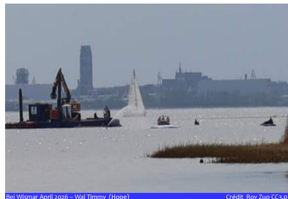
Bei Wismar April 2026 – Wal Timmy (Hope)